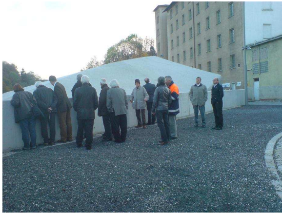
Wasserkraftwerk „die Welle“