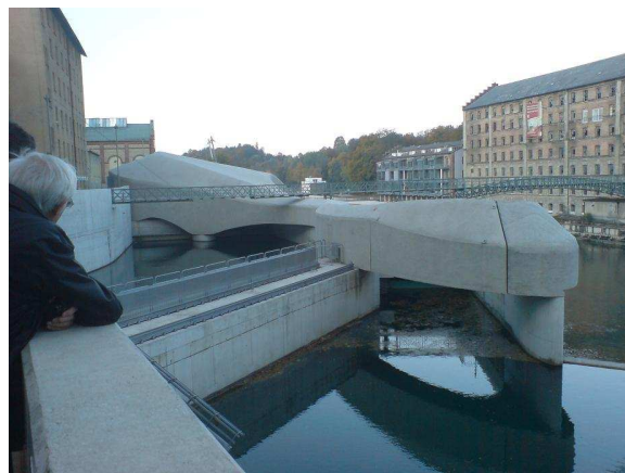
Wasserkraftwerk „die Welle“